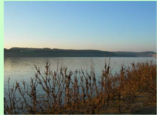
FOTO 5 ↑- rami di alberi sommersi in parte si protendono verso il cielo